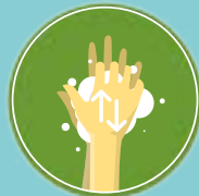
Lave os dorsos