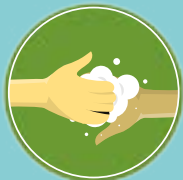
Esfregue as unhas na palma da outra mão