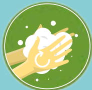
Esfregue uma palma contra a outra