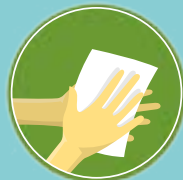
Seque com toalha descartável