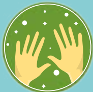
Muito bem, suas mãos estão limpas!

2. Evite tocar olhos, nariz e boca. Se for inevitável, higienize suas mãos antes e depois do contato.