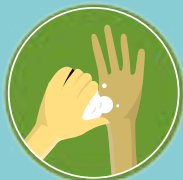
Esfregue os polegares