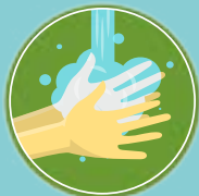
Enxágue as mãos